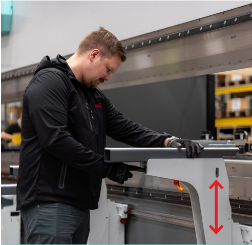
Kevyt sivuttaissiirto lineaarijohteilla